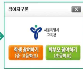
학생 참여하기 버튼 클릭

※ 검사 대상 : 중학교 1학년, 고등학교 1학년(학생이 직접 참여합니다.)