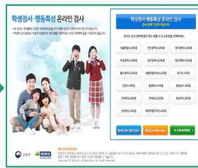
해당 시·도 선택