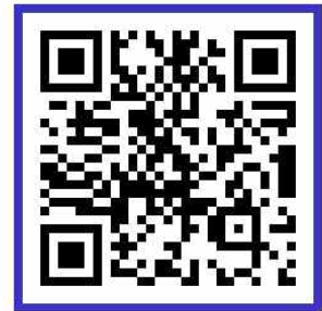
과목선택 랜선박람회 (인천광역시 교육청)