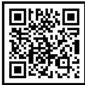
2015개정 교육과정 선택교과 안내 (서울특별시 교육청)