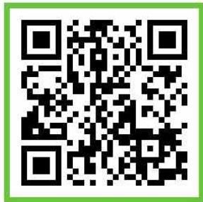
고교학점제 과목안내 및 가이드북