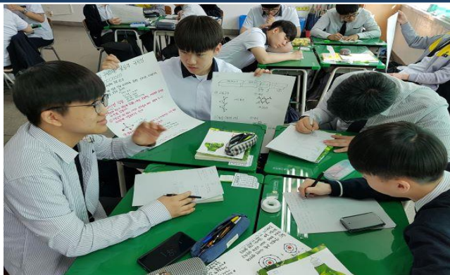
교실 속 배움활동