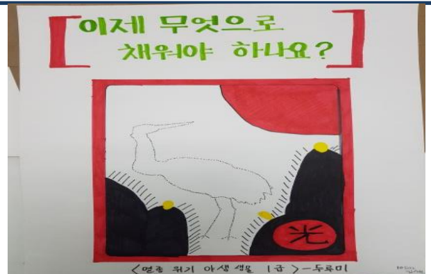
멸종위기종 보호 포스터 그리기 활동