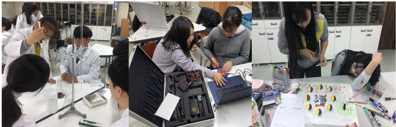
포천 아트밸리 지질탐사