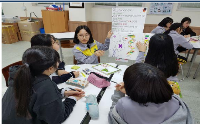
과학실 속 배움활동