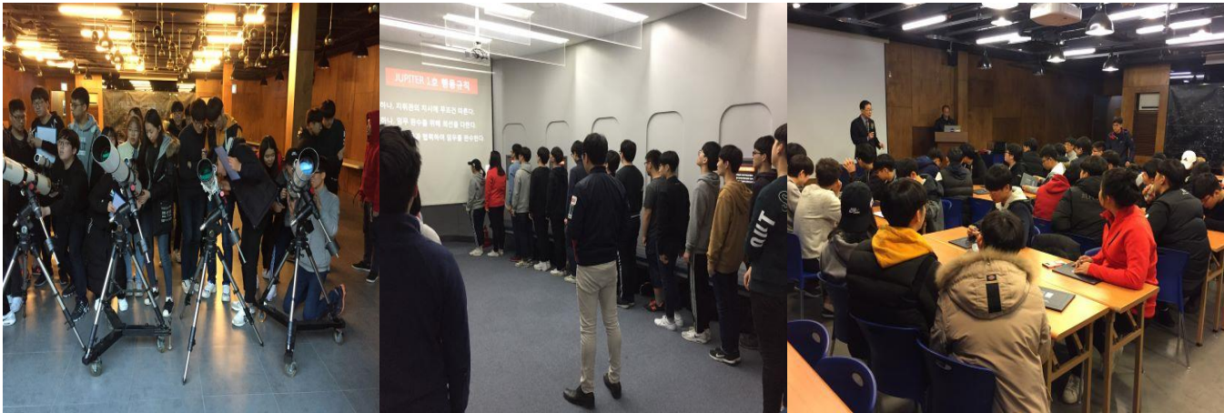
송암스페이스센터 천체관측 체험활동