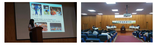
1.진학지도연구 / 2.중국문화교류 / 3.외국어말하기대회 / 4.토론포럼