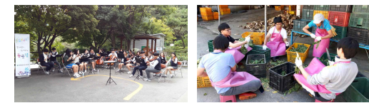
1.배움중심수업 / 2.과학재능기부 / 3.오케스트라 / 4.가평꽃동네봉사