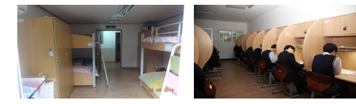
1.진학상담 / 2.면접지도 / 3.기숙사 / 4.심화반독서실