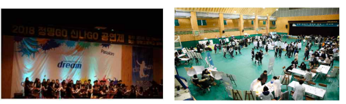
1.학부모총회 / 2.학생회선거 / 3.신나GO:정명GO / 4.동아리발표회